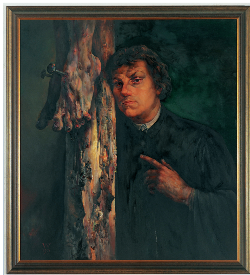
Christoph Wetzel: Luther unterm Kreuz (Dresden 1999) Evang. Kirche St. Jakobus Weißenstadt.

Das schwarze Kreuz in der Mitte steht für den gekreuzigten Christus; das rote Herz – gebettet in eine weiße Rose –, für den Glauben an ihn, der Freude, Trost und Frieden bringt. Der blaue Hintergrund verweist auf den Himmel und der goldene Ring, der das Wappen umschließt, versinnbildlicht, dass Frieden und Seligkeit im Himmel auf ewig kein Ende haben werden. (Diese Lutherrose hat allerdings einen netten Fehler mit ihren neun statt fünf Rosenblättern.)