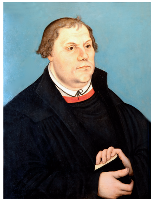
Lutherbild aus der Werkstatt Lucas Cranach d. Ä. um 1540 (Lutherstube der Veste Coburg).

Gott selbst erhält seine Kirche. Unsere Aufgabe ist es, das Evangelium zu verkünden und zu leben. Dazu bedarf unsere Kirche einer missionarischen Wendung nach außen und einer geistlichen