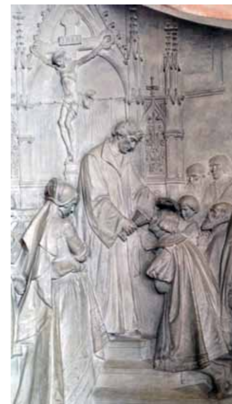
Darstellung des ersten evangelischen Abendmahls in der Dresdner Kreuzkirche. Der Originalentwurf (Bild) befindet sich in der Marienkirche in Königsberg i. Bay.

„Ich will allen zum Exempel, die sich warnen lassen wollen, hier meine eigene Erfahrung anzeigen, damit man lerne, welch ein listiger Schalk der Teufel ist. Es ist mir etliche Male widerfahren, daß ich mir vorgenommen habe, auf den oder den Tag zum Sakrament zu gehen. Wenn der Tag gekommen ist, so ist solche Andacht weg gewesen, oder sonst irgendein Hindernis gekommen, oder ich habe mich nicht